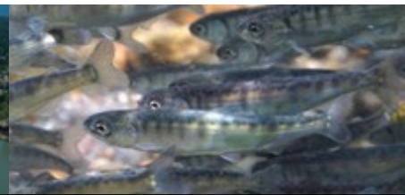
HABITAT DU SAUMON