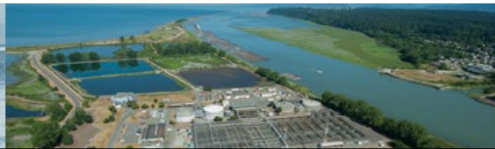
STATION D'ÉPURATION DES EAUX USÉES DE L'ÎLE D'IONA